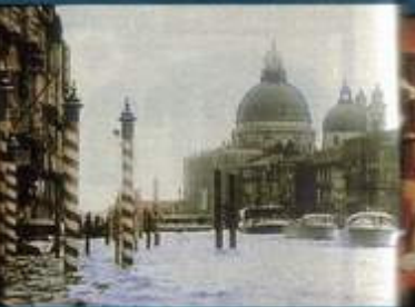
Finalmente a casa