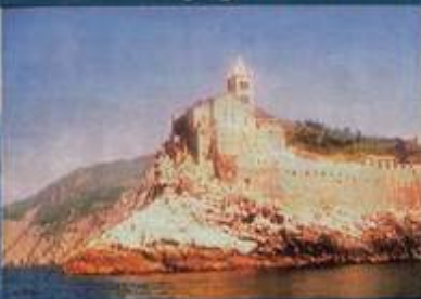
Ancorate al largo