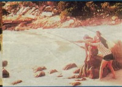
Ultime immagini pervenute