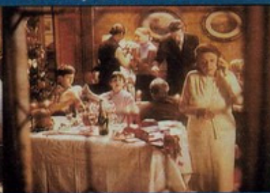
Auguri a chi si ama