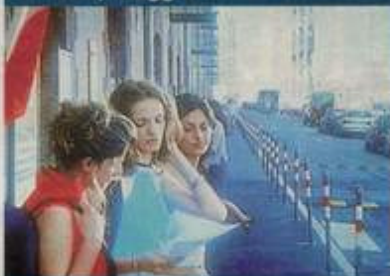
Pronte alla partenza